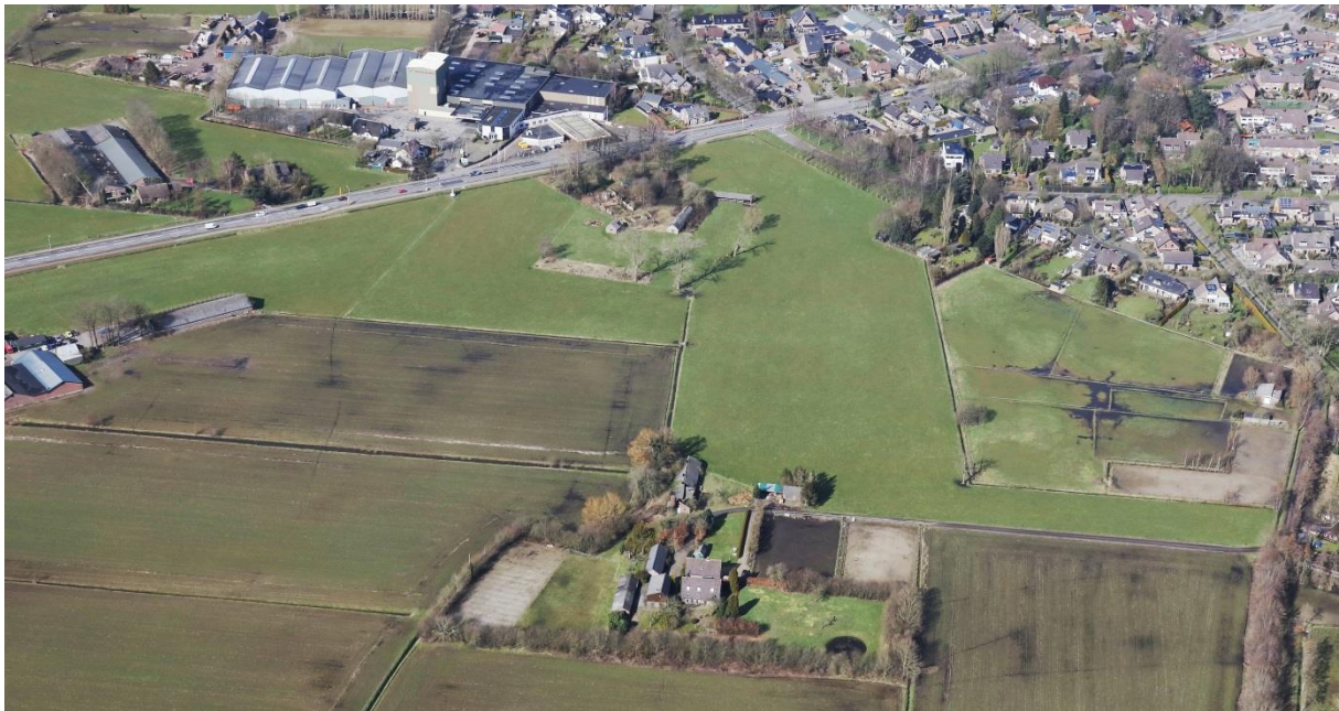
Luchtfoto van (een gedeelte van) de bouwlocatie Holzenbosch. Linksboven de Baron van Nagellstraat en rechtsonder de Schoonengweg.